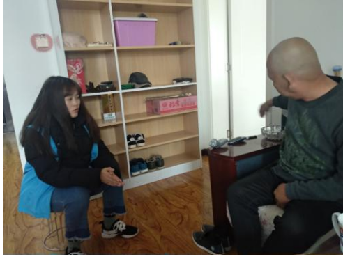
图五：老年人“一对一”上门服务。