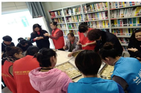
图二：冬至节“包饺子，送温暖”活动。