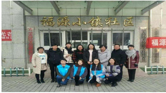
图一：项目中期评估。