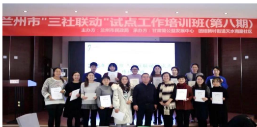
图四：兰州市“三社联动”试点工作培训班（第八期）。