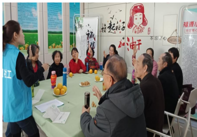
图三：社区社会组织孵化-福源太极健身队成立。